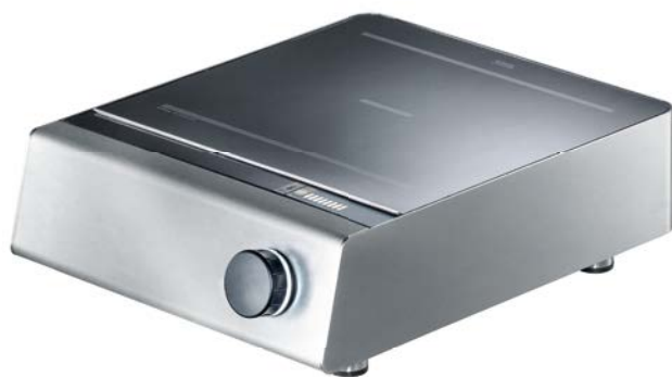
INSTINCT Hob 3.5/5